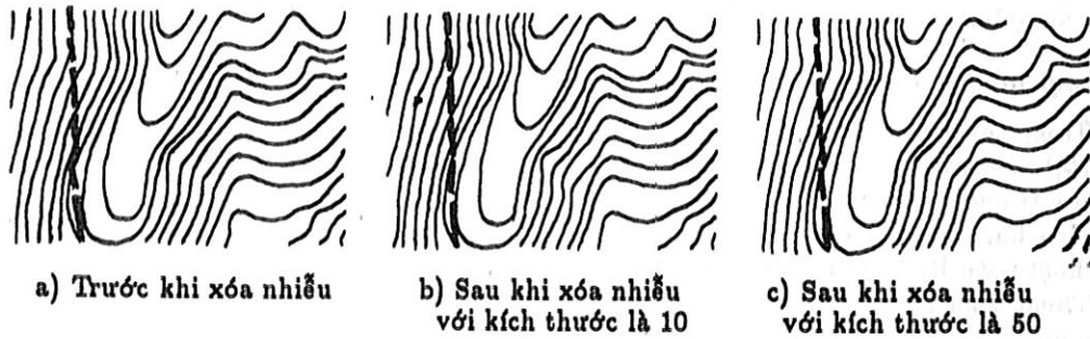
Hình 5. Kết quả của phép khử nhiễu